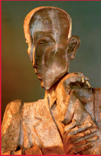
François Mauriac par Ossip Zadkine