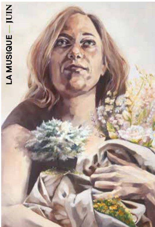
LA MUSIQUE — JUIN