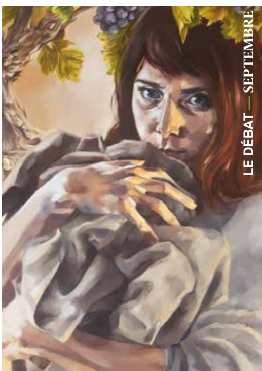
LE DÉBAT — SEPTEMBRE