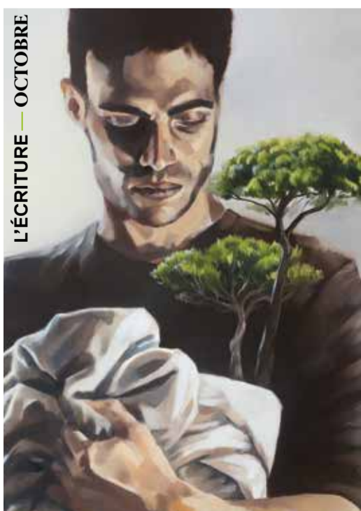
L'ÉCRITURE — OCTOBRE